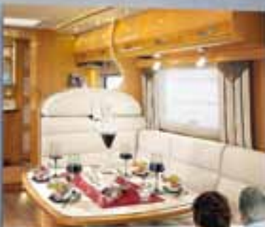
Série Spéciale « 50 ans » - Nouveau 10001

Nouvelle collection 2012, la collection des 50 ans La collection qui en inspirera d'autres.