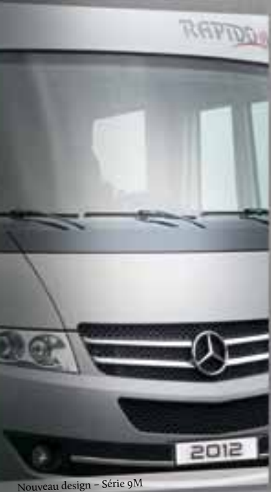
Nouveau design - Série 9M